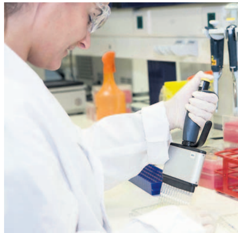
Laboratorio de Oryzon.