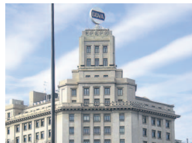
Sede de BBVA en Barcelona.

El movimiento, no obstante, deja sin ningún brazo financiero aparente al territorio ante una eventual independencia pues la banca tradicional catalana se va o ha sido absorbida por otros,